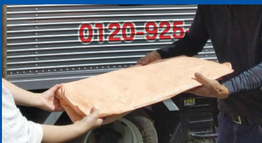
①フレポンを借りる